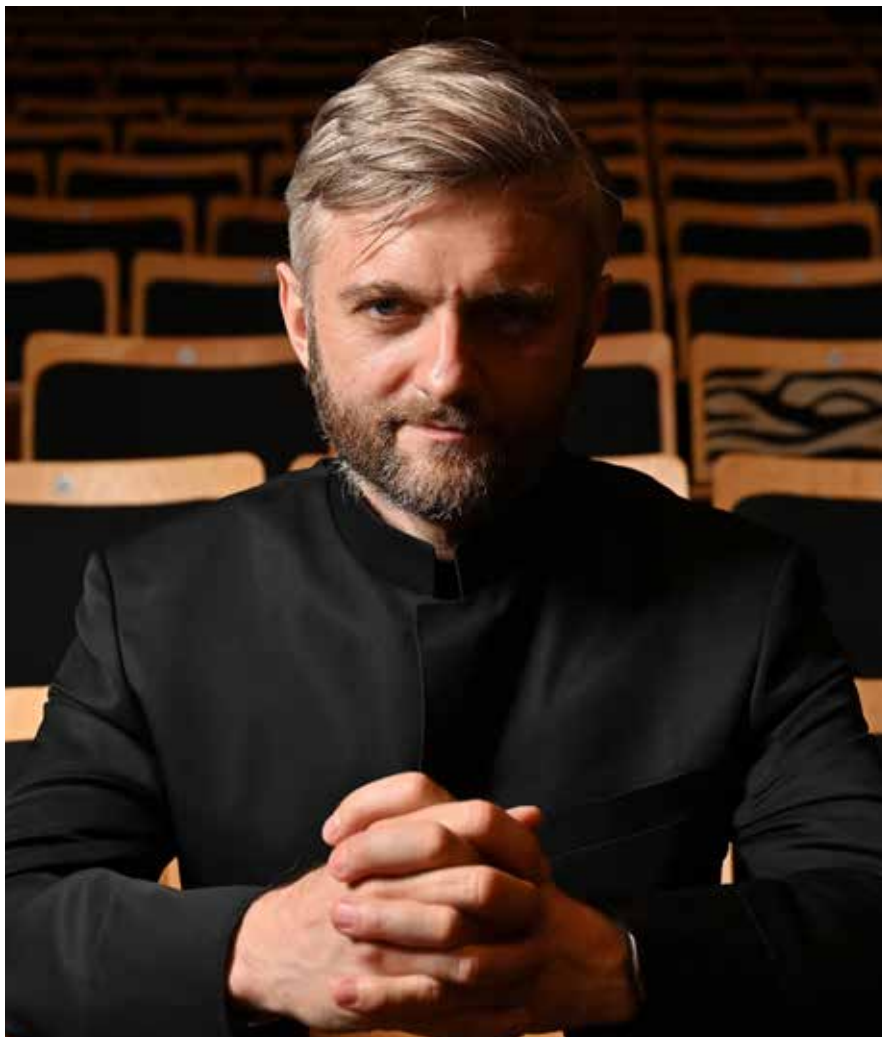
Kirill Karabits

Kirill Karabits on sündinud ja üles kasvanud Kiievis, õppinud dirigeerimist Kiievi konservatooriumis ja Viini Muusikakõrgkoolis (Universität für Musik und darstellende Kunst Wien). Praegu elab ta Pariisis. Karabits on võtnud oma südameasjaks ukraina unustatud helilooja Théodore Akimenko loomingupärandi tutvustamise.