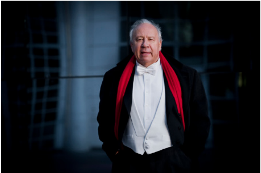
Neeme Järvi

NEEME JÄRVI on üks tänapäeva hinnatuimaid dirigente maailmas. Ta on juhatanud tipporkestreid, teinud koostööd parimate solistidega ning tema hiiglaslikus diskograafias on 535 albumit ja kogumikku.