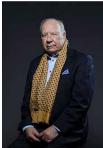
Neeme Järvi

NEEME JÄRVI on üks tänapäeva hinnatuimaid dirigente maailmas. Ta on juhatanud tipporkestreid, teinud koostööd parimate solistidega ning tema hiiglaslikus diskograafias on rohkem kui 500 albumit. Neeme Järvi muljetavaldavat diskograafiat ehivad Prokofjevi, Šostakovitši, Straussi, Mahleri, Dvořáki, Glazunovi, Griegi, Sibeliuse, Nielsen'i ja Brahmsi kõigi sümfooniade kõrge hinnatud salvestused.