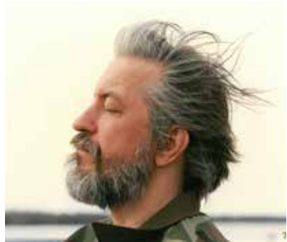
Lepo Sumera © Arvo Iho