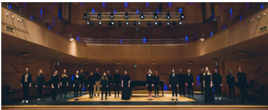
EMTA koor