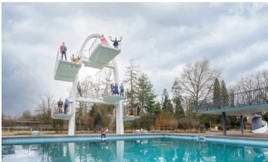
Ensemble Musikfabrik

Alates selle asutamisest 1990. aastal on ENSEMBLE MUSIKFABRIK (Landesensemble NRW) olnud üks juhtivaid kaasaegse muusika ansambleid. Nagu ansambli nimigi ütleb, tegeleb Ensemble Musikfabrik eelkõige uute teoste tellimise ja produtseerimisega, tehes sageli tihedat koostööd heliloojatega. See rahvusvaheline Kölnis tegutsev solistide ansambel on andnud palju kontserte Saksamaal ja välismaal, esinenud festivalidel, enda korraldatud kontserdisarjade „Musikfabrik im WDR“ ja „Montagskonzerte“ raames (sageli otseülekannetega) ning võtnud osa heli- ja videoproduksioonidest. WERGO andis välja CD-sarja „Edition Musikfabrik“. Selle kaanekujunduse autor on Gerhard Richter, kes valis välja plaatidel kasutatud maalid. 2014. aastal asutas ansambel oma plaadifirma Label Musikfabrik.