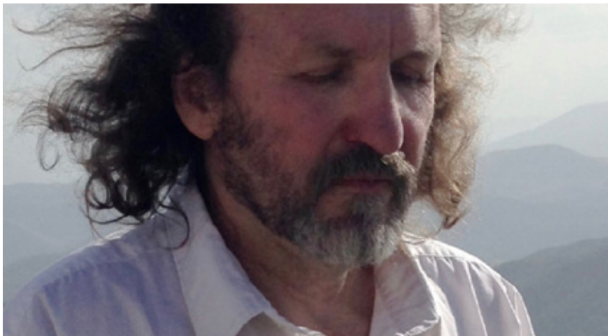
Toivo Tulev