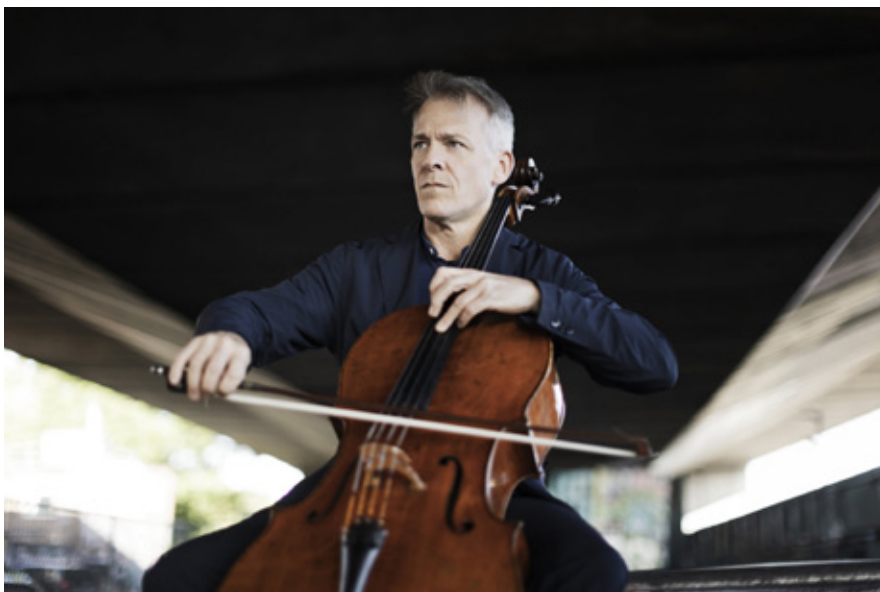
Alban Gerhardt.

ALBAN GERHARDTI tuntakse kui maailma üht mitmekülgsemat tšellomängijat, kelle puhul hinnatakse enim tema tehnilist meisterlikkust, sügavat musikaalsust ja lõputut kunstilist uudishimu. Olulisemad orkestrid, kellega ta koos on esinenud, on Kuninglik Concertgebouw' Orkester, kõik Briti ja Saksa raadioorkestrid, Berliini Filharmoonikud, Zürichi Tonhalle Orkester, Prantsuse Rahvusorkester, Hispaania Riiklik Orkester, Clevelandi Orkester, Philadelphia ja Chicago sümfooniaorkestrid ja New Yorgi Filharmoonikud. Ta on lavale astunud selliste dirigentide käe all nagu Christoph von Dohnányi, Kurt Masur, Klaus Mäkelä, Christian Thielemann, Simone Young, Susanna Mälkki, Vladimir Jurowski ja Andris Nelsons.