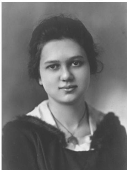
Ruth Crawford Seeger

Crawford ise aga nii rahulolev ei olnud. Ta pidas New World kvarteti esitust liiga aeglaseks, et näidata teose meloodilise joone pikka voogu, mis liigub instrumentidelt instrumentidele. Crawfordi uurija Judith Ticki sõnul oli just see probleem stiimuliks keelpilliorkestri versiooni loomiseks: „Mõistes, kui