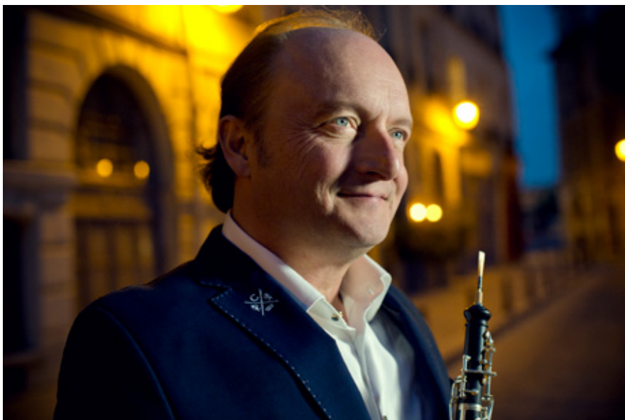
François Leleux

„Kui kohal on dirigent ja solist, kellel on prantsuse oboisti François Leleux’ga võrreldav karisma ja musikaalsus, on efekt kahekordne.“ (The Arts Desk)