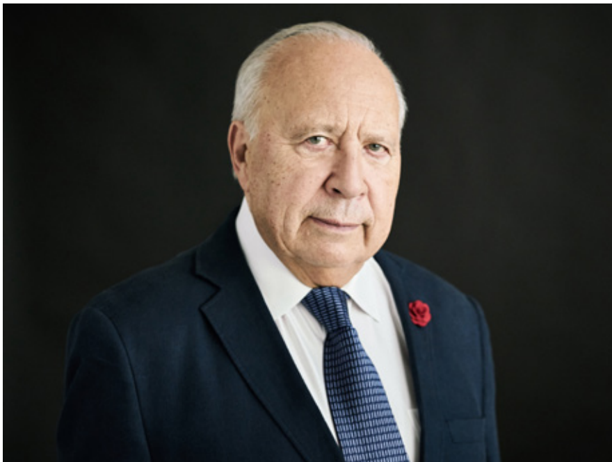
Neeme Järvi

Suure muusikute dünastia pea NEEME JÄRVI on üks tänapäeva hinnatuimaid dirigente. Ta on juhatanud maailma tipporkestreid, teinud koostööd parimate solistidega ning tema kui ühe enim plaadistava dirigendi diskograafiasse kuulub ligi 500 plaati.