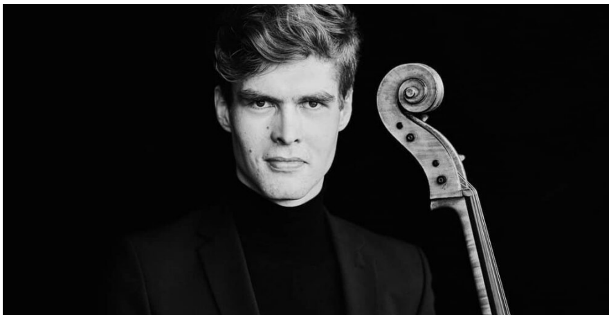
Valle-Rasmus Roots.