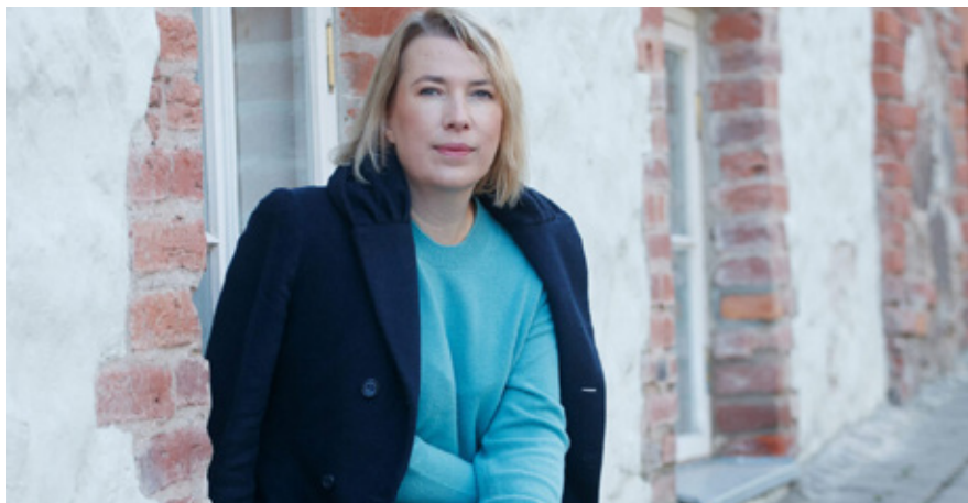
Age Veeroos.

„ja nüüd on ikka veel nüüd kuigi kõik libiseb kuigi kõik kulgeb edasi jättes nahale uurde ei ole teada miks või mille peal miski möödub kõri väsis õhu segamisest sõna vormimisest miski hämar-öine kõditab ehk on see rammetus ent maailm peab saamagi vanaks ja vabanema oma piirdest kuni keha üksi kohtab lõpmatust unes ei tea ta et unenägu ongi asendanud elu ja et kõik jääb seda asendust pühitsedes vakka siiski miski liigatab pea tagamaal kas on see vari mis tuleb mis kohe ka läheb või on see lihtsalt maailm mis lõpuks piseneb oma tihkeks suitsuks [---]“