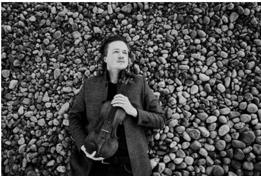
Henning Kraggerud.

Norra viiuldaja HENNING KRAGGERUD on Arktilise Filharmoonia Kammerorkestri kunstiline juht. Tema erakordne artistlik haare on tingitud mitmekülgisusest ja kirest muusika vastu, samuti tema viiulimängu ehedast kvaliteedist ja etteastete ilust. Kraggerudi pedagoogitöö ja hariduslikud kirjutised annavad põneva ülevaate mitmetahulisest lähenemisest muusika loomisele. Nagu kuulsad viiuldajad Fritz Kreisler ja Eugène Ysaÿe omal ajal, komponeerib ja esitab ta omaenda teoseid, teeb seadeid ning loob kadentse kontsertidele.