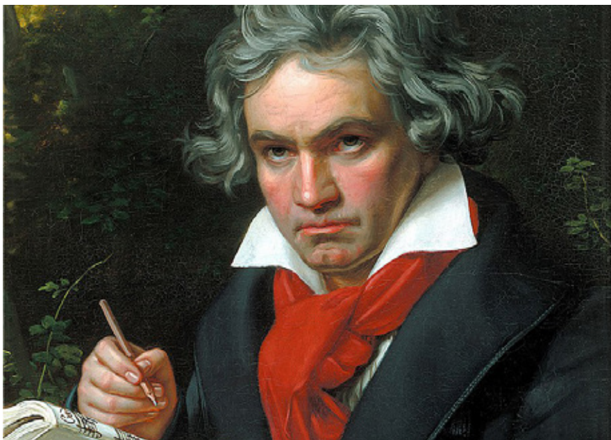
Ludwig van Beethoven.