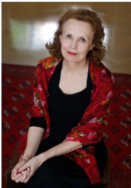
Kaija Saariaho.