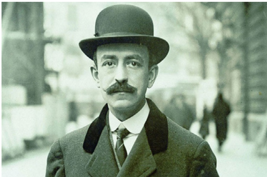
Manuel de Falla.