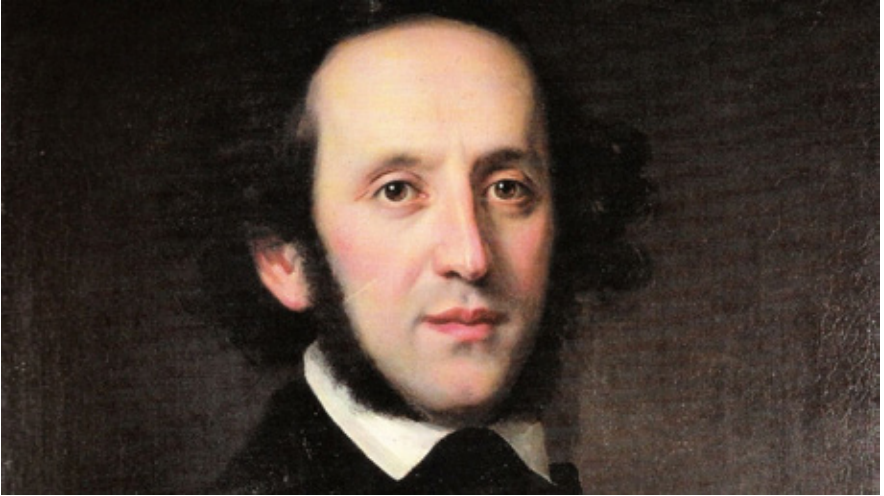
Felix Mendelssohn Bartholdy (1809–1847) Sümfoonia nr 3 a-moll, op. 56 (1842)

Felix Mendelssohn Bartholdy oli saksa helilooja, kes teostas end lisaks komponeerimisele veel pianisti, organisti ja dirigendina. Tema rolli lääne kunstmuusikas on raske alahinnata, sest üürikest elust hoolimata jättis ta sügava jälje muusikakultuuri, taaselustades toonaseks pea unustusse vajunud Bachi suurteosed ning rajades Leipzigiisse Saksamaa esimese konservatooriumi. Hoiakud Mendelssohni loomingusse on läbi aja olnud muutlikud. Ehkki pärast tema surma polnud Euroopa muusikaelus vaat et midagi aktuaalsemat, kui tema loominguga tegelemine, varjutasid seda peatselt uued kunstivoolud ning peadtõstev antisemitism, mis tõi lõpuks kaasa ka tema loomingu keelustamise Natsi-Saksamaal. Pärast teist maailmasõda algas tema muusika renessanss.