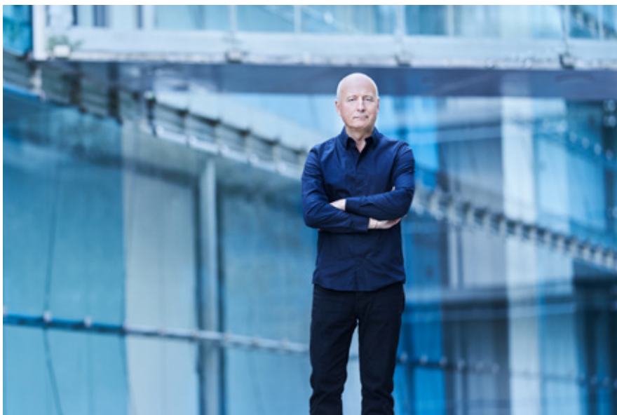
Paavo Järvi.

PAAVO JÄRVI on laialdaselt tunnustatud kui üks tänapäeva silmapaistvamaid dirigente, keda seob tihe koostöö maailma parimate orkestritega. Ta on Zürichi Tonhalle orkestri peadirigent, alates 2004. aastast Deutsche Kammerphilharmonie Bremen kunstiline juht ning Eesti Festivaliorkestri asutaja ja kunstiline juht. Hooajast 2022/23 on ta ka NHK sümfooniaorkestri audirigent.